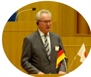
講演された市長マルコ・グロサ氏（左）と前市長ゲルト・ラインハルト氏（右）